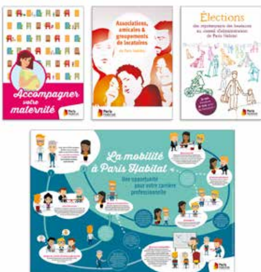
PARIS HABITAT Création de divers outils de communication (flyer, PLV, dépliant...).