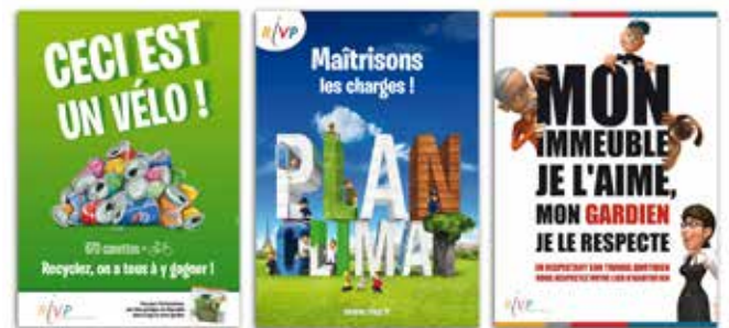
RIVP Création d'affiches et dépliants pour informer les locataires des événements dans leur immeuble ou leur quartier.