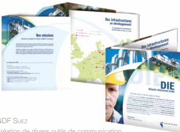
GDF SUEZ Création de divers outils de communication.