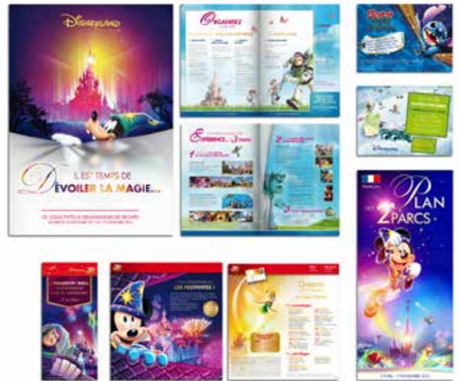
DISNEYLAND PARIS Création de flyers, dépliants et brochures pour le parc d'attraction.