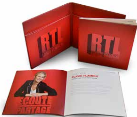
RTL Création d'un coffret haut de gamme de deux livres présentant la grille des programmes de l'année.